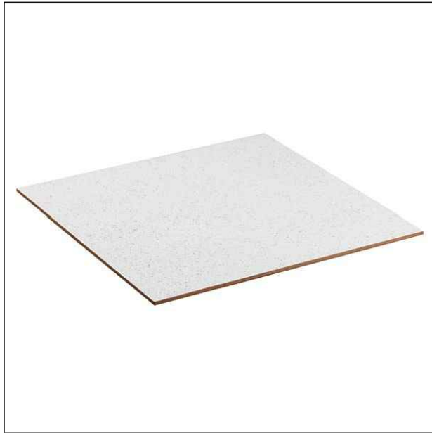
Piso Acetinado Bold Liso Quasar Branco 43x43 Eliane ou equivalente